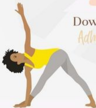
Triangle Pose Trikonasana