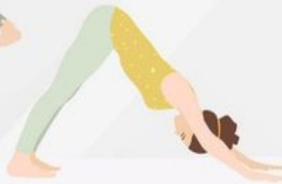
Downward-Facing Dog Adho Mukha Svanasana