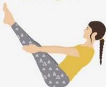
Boat Pose Paripurna Navasana