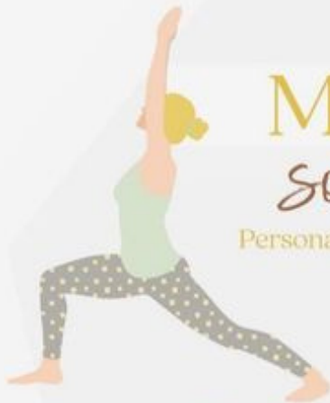
Crescent Pose Anjaneyasana