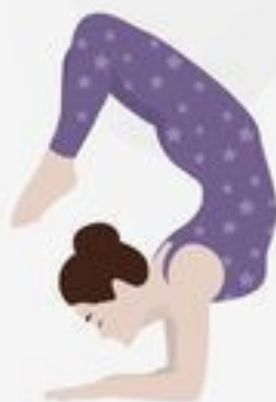
Forearm Stand Pincha Mayurasana