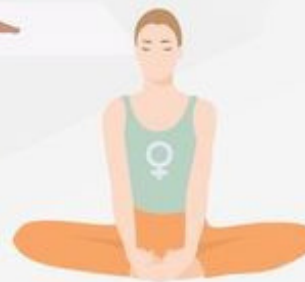
Bound Angle Pose Baddha Konasana