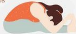
Forward Bend Paschimottasana