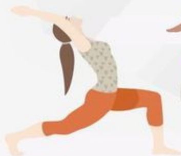
Crescent Pose Anjaneyasana