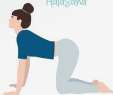
Cow Pose Bitilasana