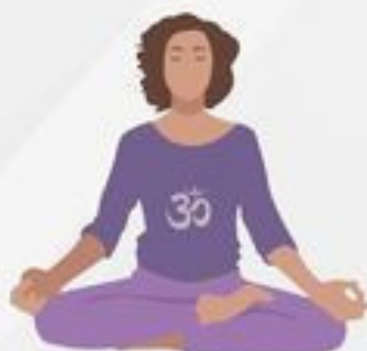
Lotus Pose Padmasana