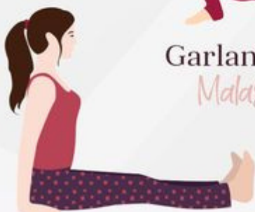
Staff Pose Dandasana