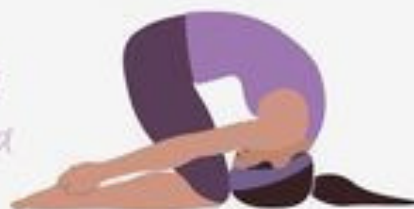
Rabbit Pose Sasakasana