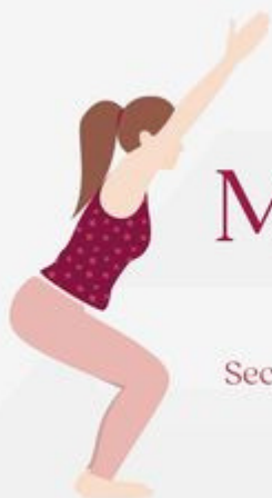
Chair Pose Utkatasana