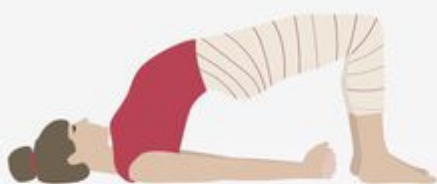
Bridge Pose Setu Bhandasana