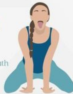
Lion Pose Simhasana