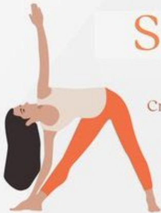
Triangle Pose Uttitha Trikonasana