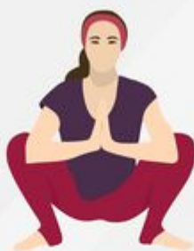
Garland Pose Malasana