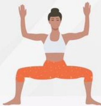
Goddess Pose Utkata Konasana