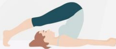
Plow Pose Halasana