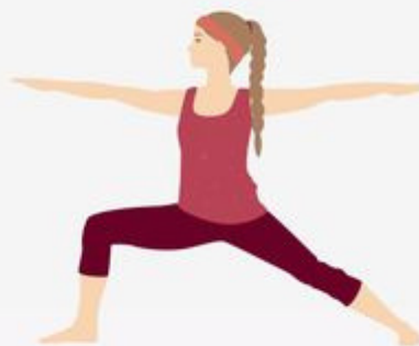
Warrior II Pose Virabhadrasana II