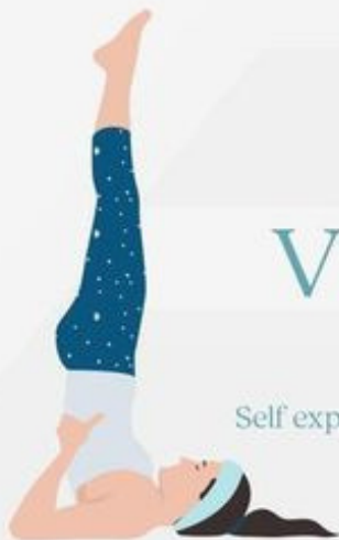
Shoulder Stand Sarvangasana