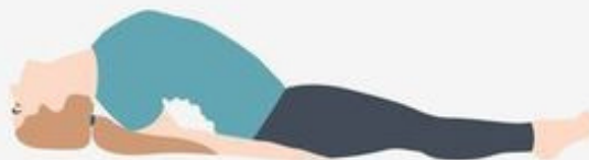
Fish Pose Matsyasana