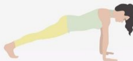
Plank Pose Kumbhakaasana