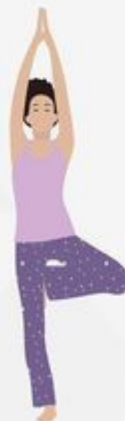
Tree Pose Vrikshasana