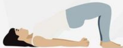
Bridge Pose Setu Bhandasana