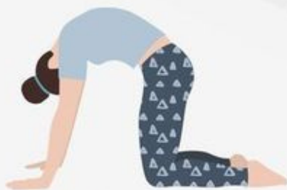
Cat Pose Marjaryasana