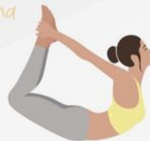
Bow Pose Dhanurasana