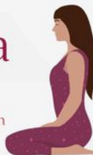
Thunderbolt Pose Vajrasana