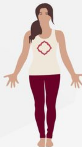
Mountain Pose Tadasana